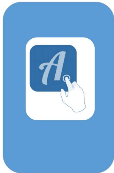
Actionbound-App rännerladen (Google Play Store oder App Store)